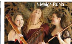
La Meiga Rubia

14 - 22 Uhr Wendelstein Zither am Berg Livemusik und Klanginstallationen